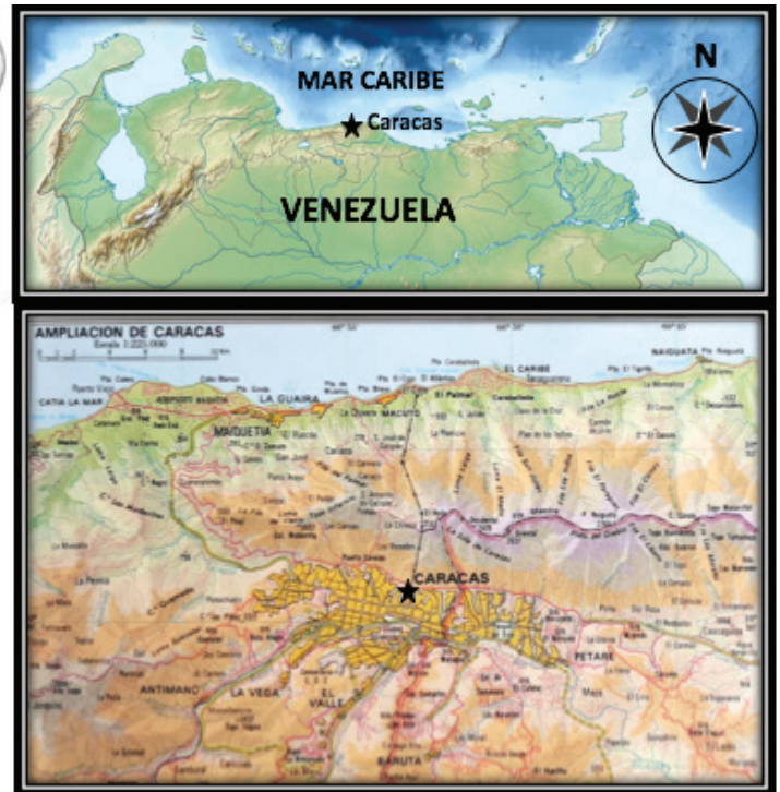
FIGURA 1. Mapa con la ubicación del lugar donde se realizaron las observaciones del Halcón Migratorio Falco columbarius en la ciudad de Caracas, Parroquia La Candelaria, región norcentral de Venezuela.