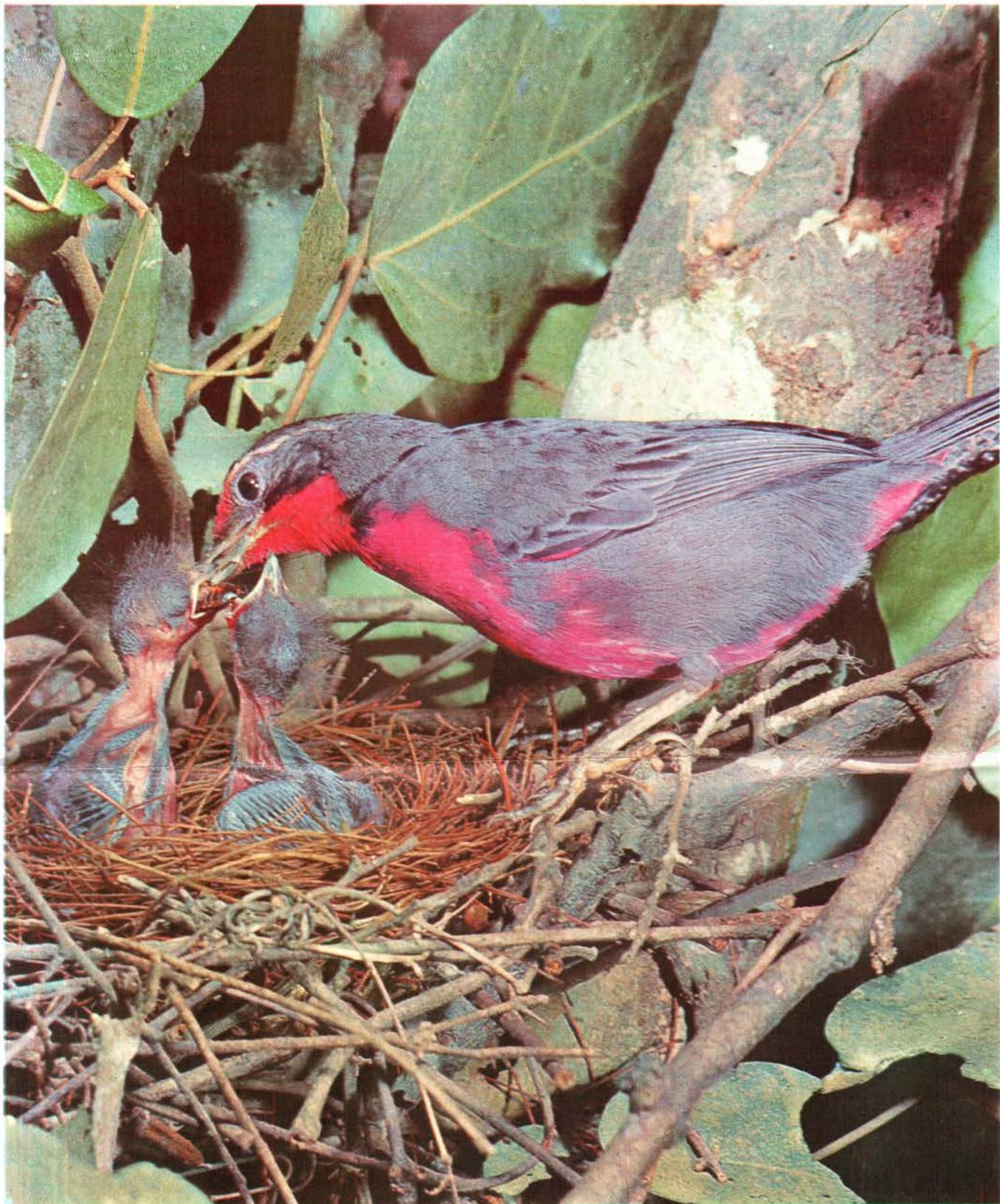
Frutero Paraulata (Macho) Rhodinocichla rosea