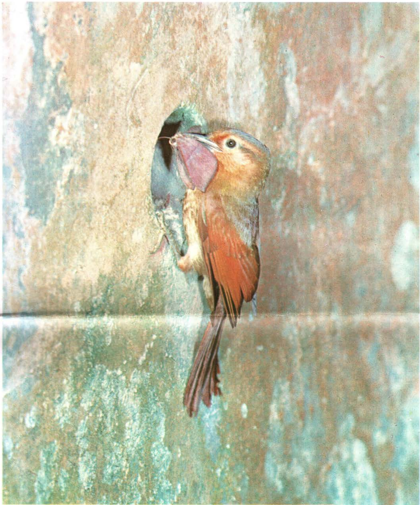
Tico-Tico Rojizo Philydor rufus