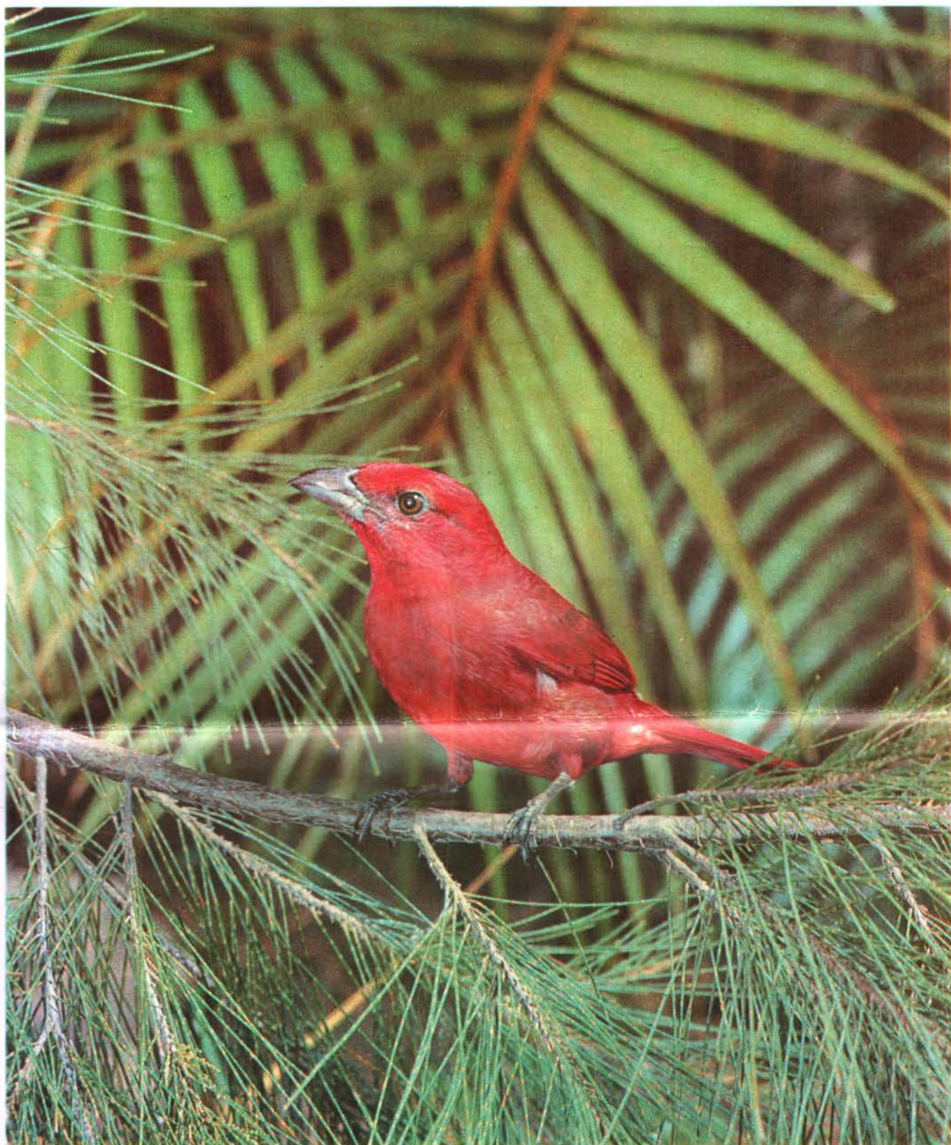
Candelo (Macho) Piranga flava

El Para. Gu. 726 - 1962 - R. Amledo H. -