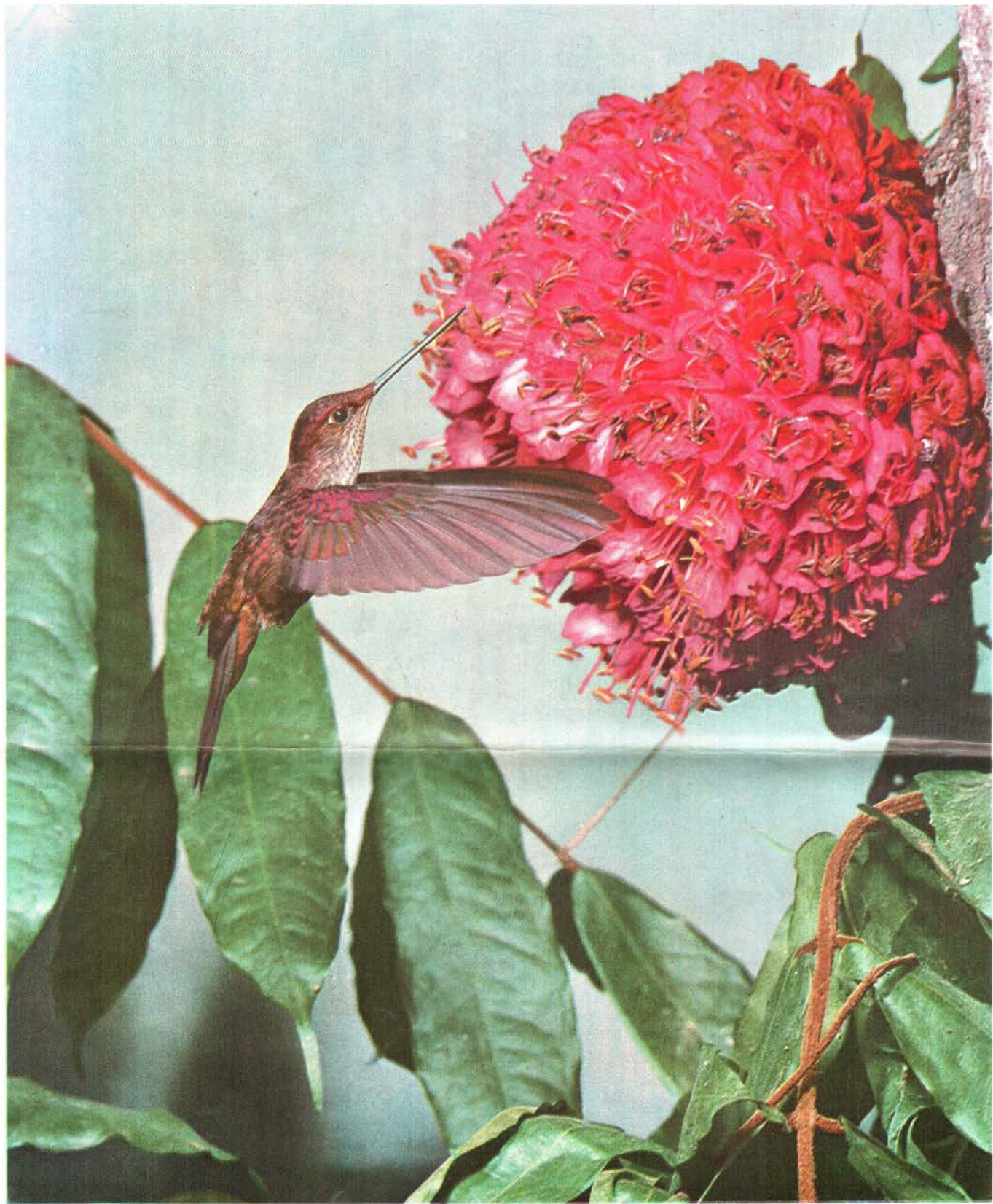
Colibri Inca Coeligena coeligena