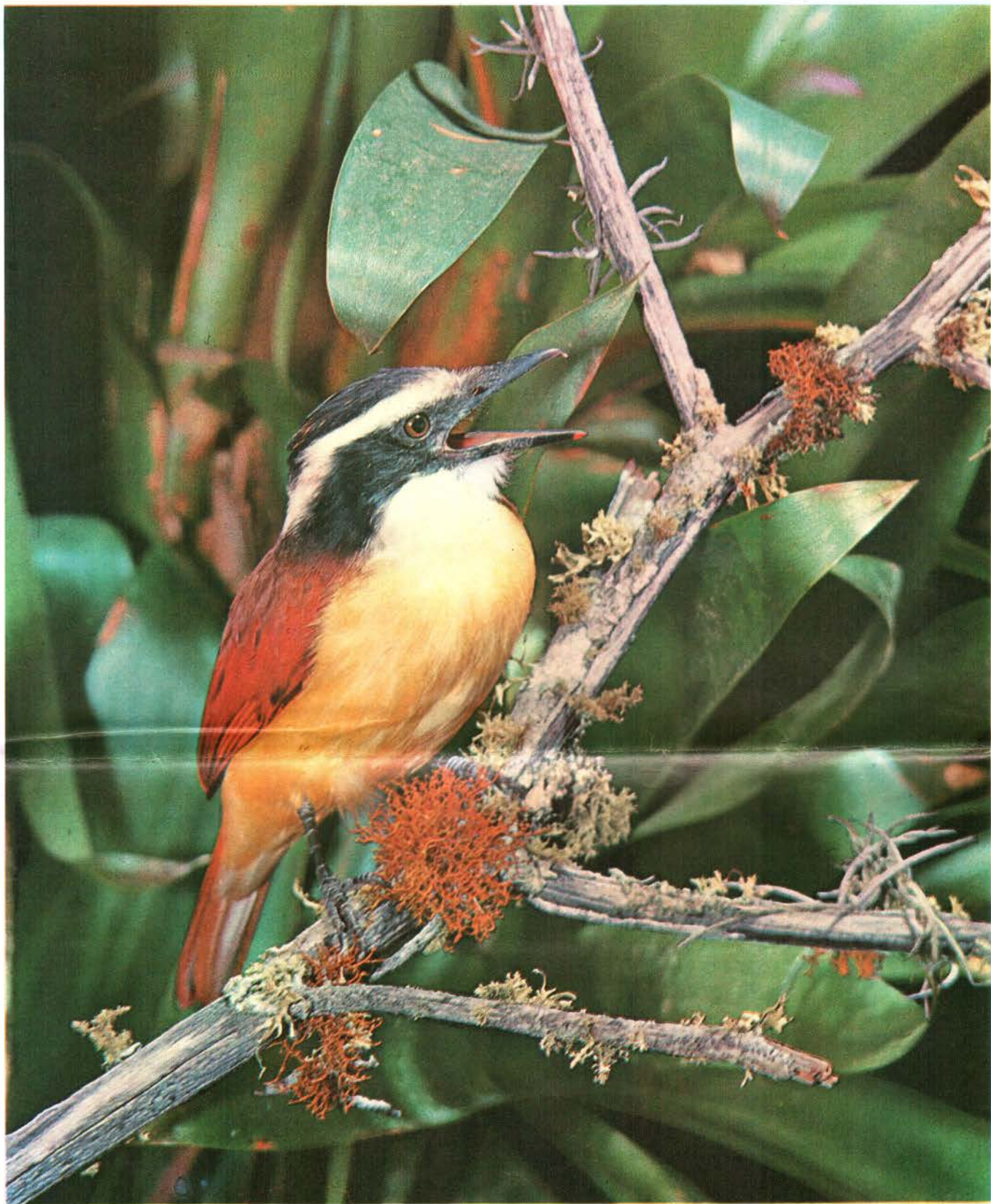
Cristofué Pitengus sulphuratus