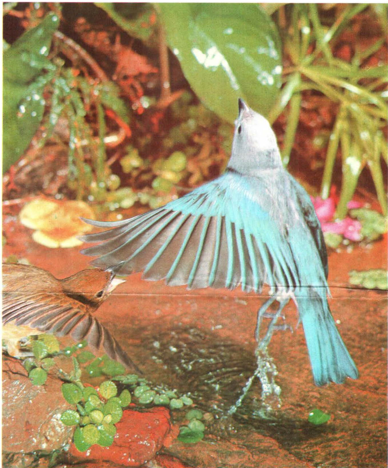
Azulejo Thraupis virens