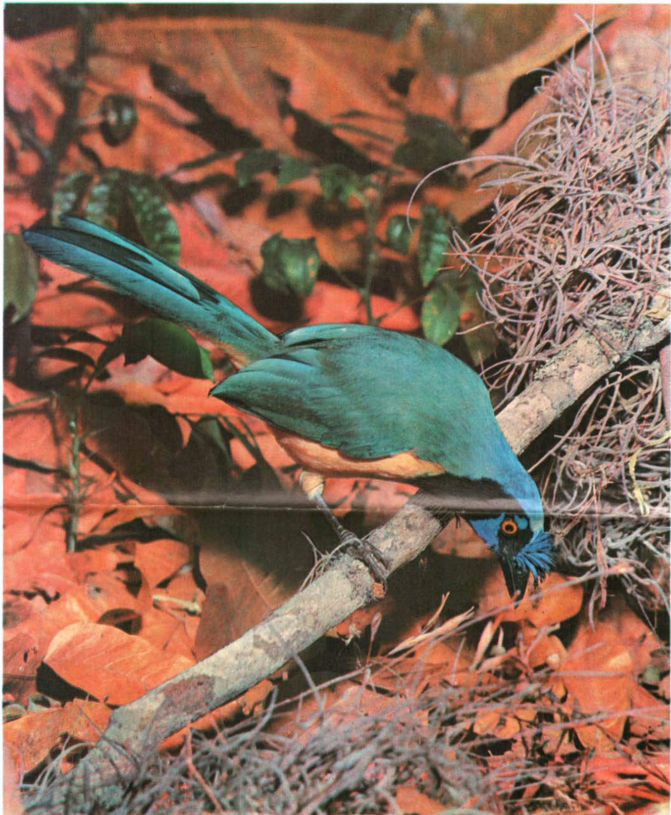
Querrequerre Cyanocorax yncas