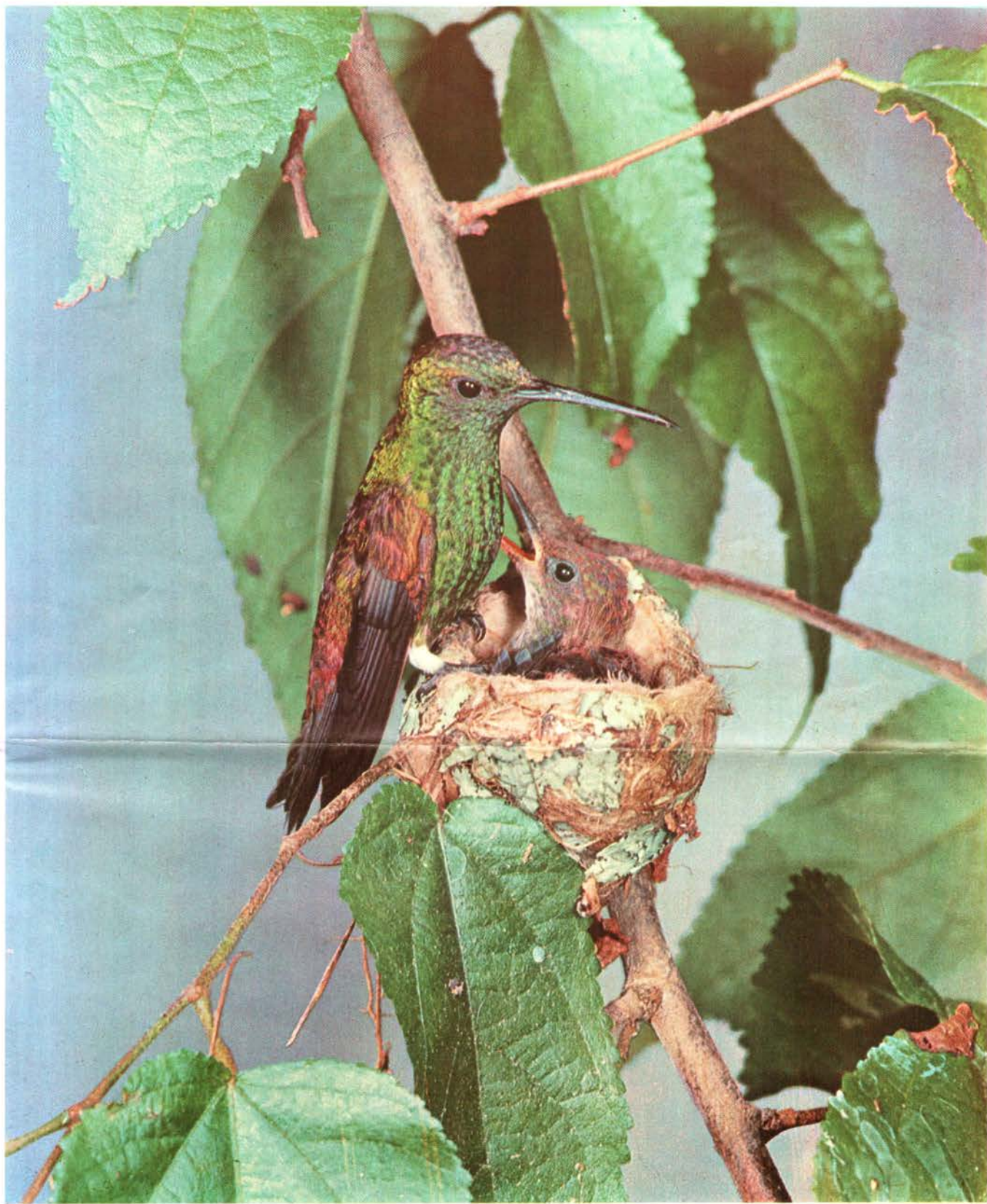
Amazilia Bronceada Amazilia tobaci