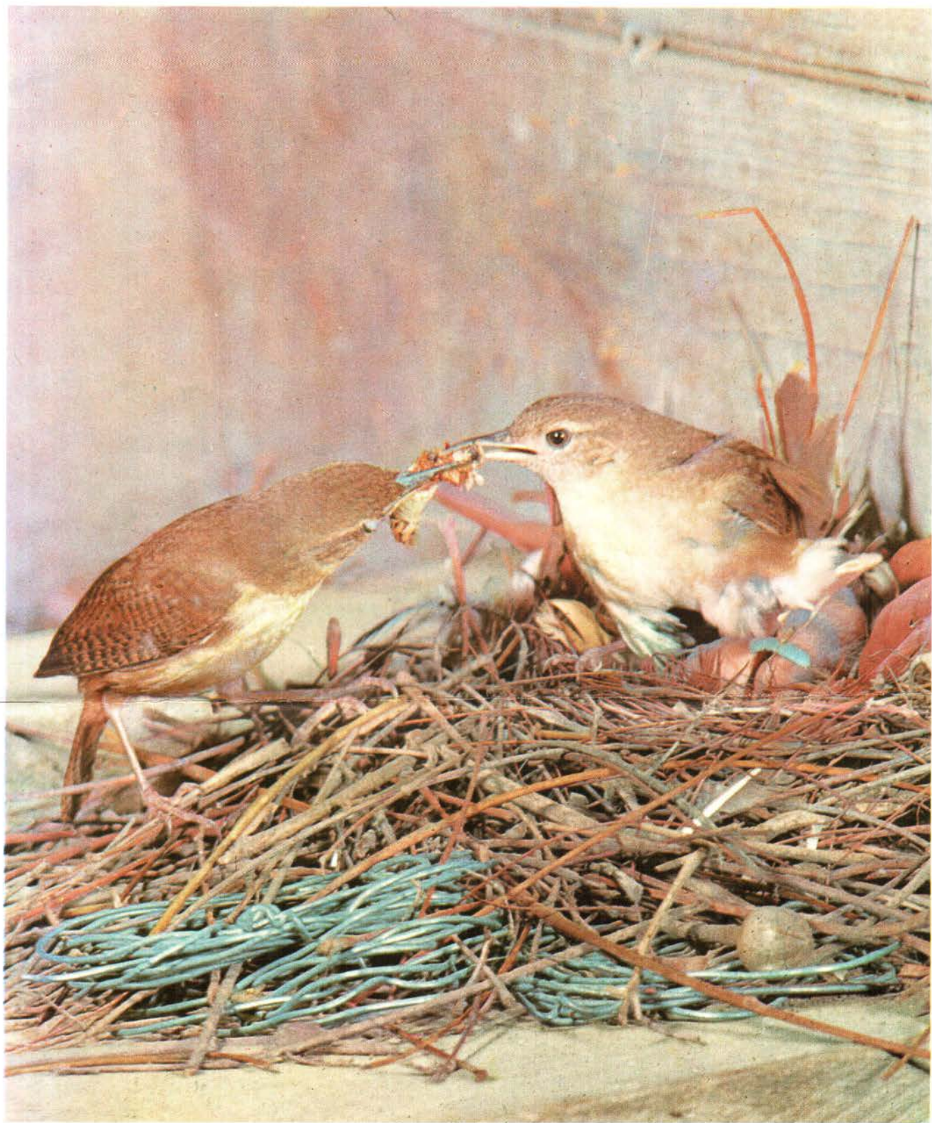
Cucarachero Troglodytes aedon