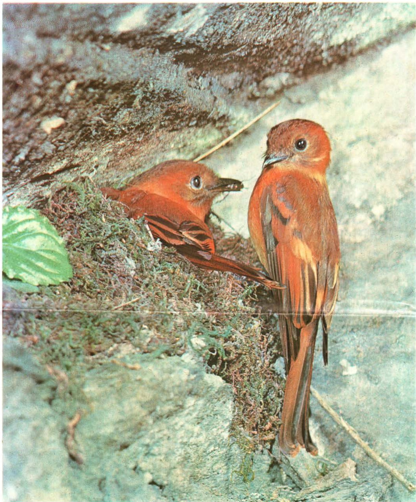
Atrapamoscas Acanelado Pyrrhomyias cinnamomee