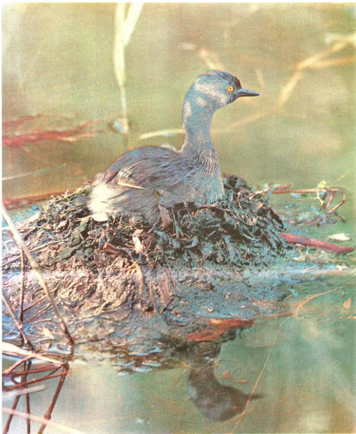
Patito Zambullidor Podiceps dominicus